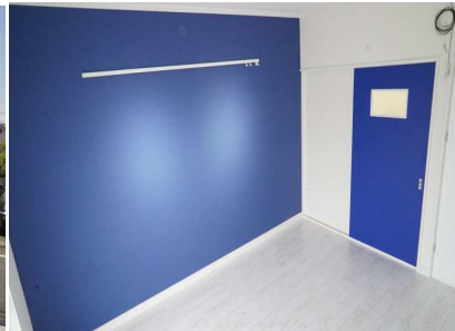
アクセントクロス工事